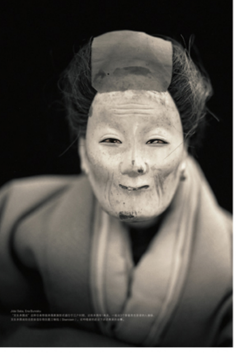
Yoshio Teraoka's 'Elderly' series