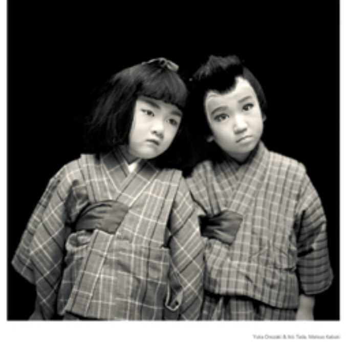
Yoshio Teraoka's 'Children' series