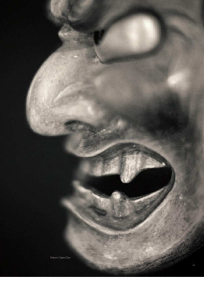
Yoshio Teraoka's 'Distorted' series

藝術 ：創作的過程。它不僅是技術的展現，更是情感的流露。藝術家們通過藝術，將自己的靈魂展現出來。