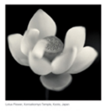
Yoshio Teraoka's 'Lotus' series