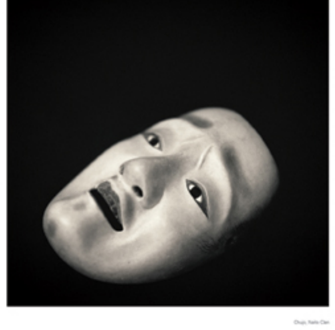
Yoshio Teraoka's 'Distorted' series