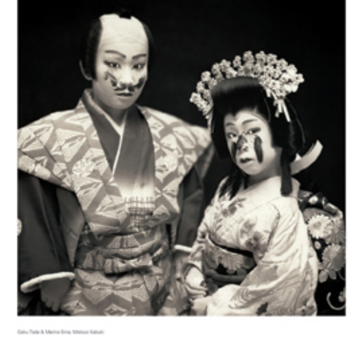
Yoshio Teraoka's 'Kabuki' series