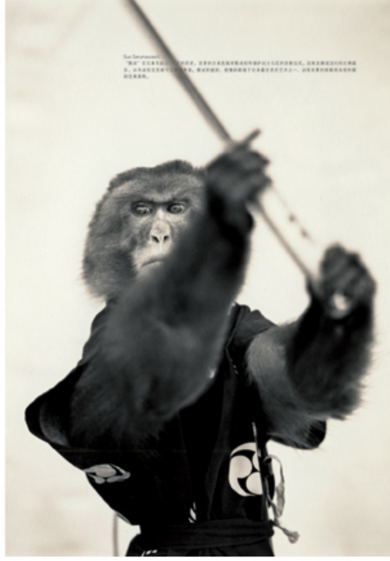
Yoshio Teraoka's 'Monkey' series