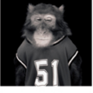
Yoshio Teraoka's 'Monkey' series

日本藝術的精髓在於其對細節的極致追求和對傳統文化的深厚底蘊。從古老的和歌到現代的浮世繪，日本藝術家們不斷探索和創新，將傳統與現代完美融合。