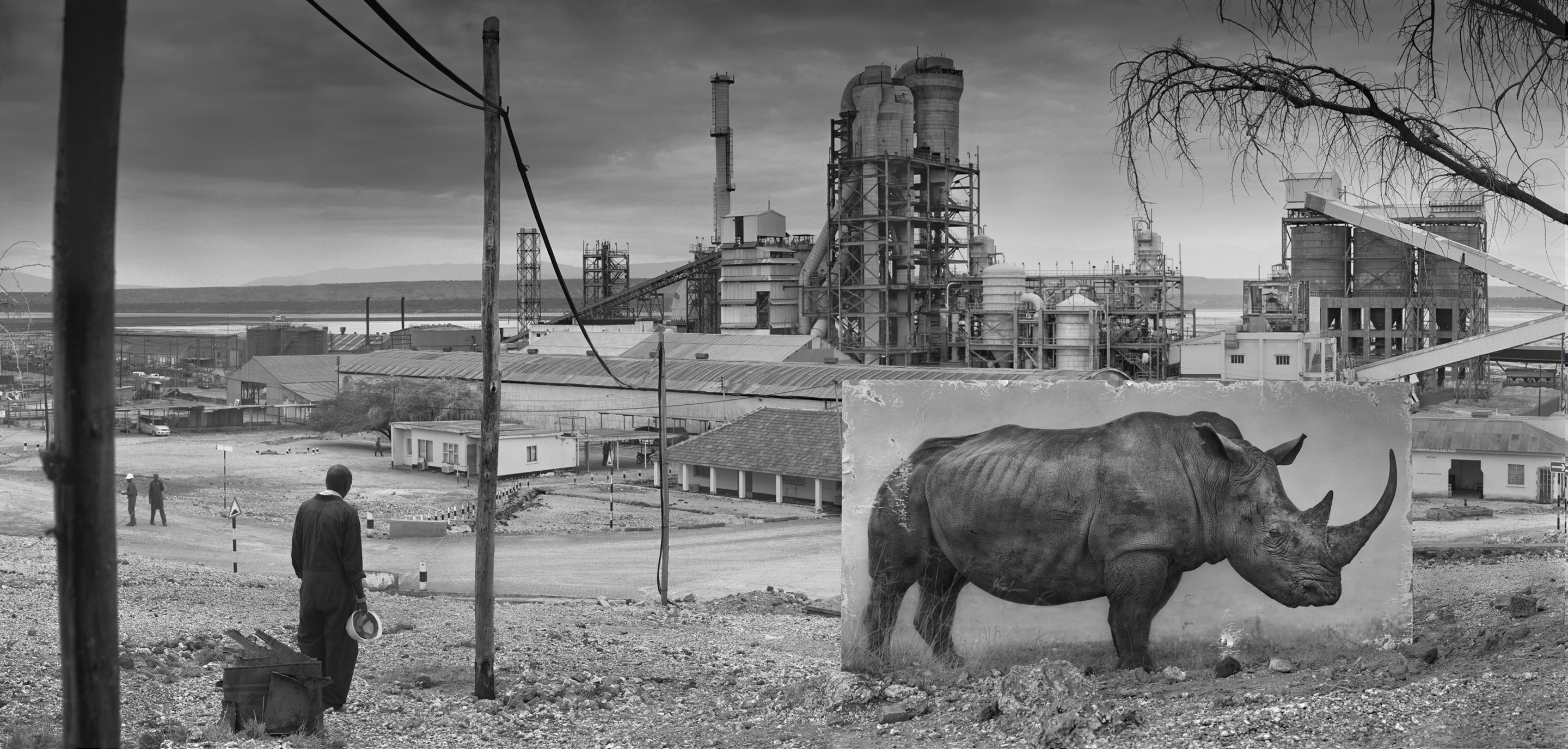
'Fabriek met neushoorn', 2014.