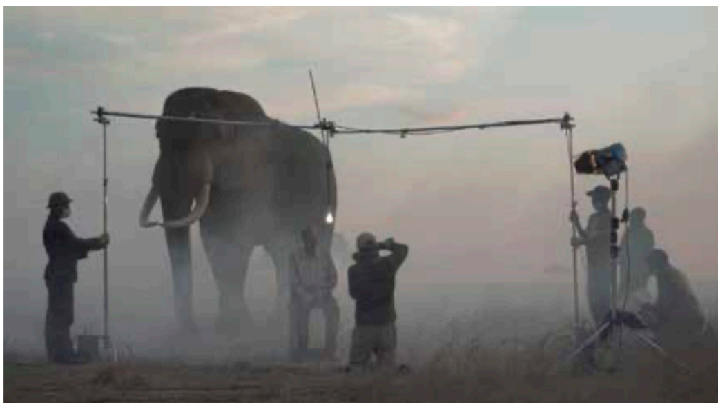
Fotograaf Nick Brandt aan het werk. Door de hitte kon hij enkel shooten vlak na zonsopgang en voor zonsondergang. Alles is echt, behalve de mist.

'De dieren leven in reservaten en zijn dus niet bang. De mensen waren dan weer heel geduldig en dankbaar voor dit project'